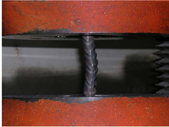
Esempio di prova a fatica oligociclica